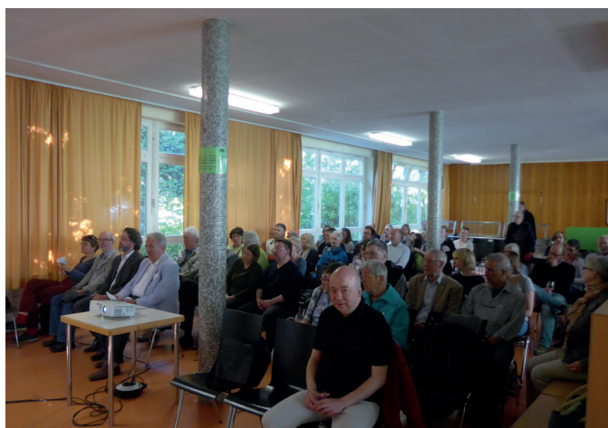
Impression vom Tag der Städtebauförderung in Dulsberg