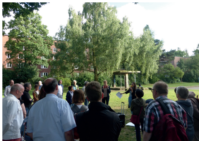
Stadtteilrundgänge auf dem Dulsberg – die Neugier war groß!

Neben der Auftaktveranstaltung und der Ausstellung der historischen Stelltafeln im Stadtteil gab es acht themenbezogene Rundgänge im Rahmen der Jubiläumswochen zur Entdeckungstour auf dem Dulsberg. Von der Architektur über die Stadtteilgeschichte bis hin zu den Grün- und Freiflächen gab es ein abwechslungsreiches Programm mit verschiedenen Themen. Die Rundgänge erfreuten sich großer Resonanz – im Schnitt besuchten rund 50 Personen, von Bewohnern über Fachleute bis hin zu interessierten Hamburgern, die geführten Rundgänge. Das Jubiläumsformat hat dazu beigetragen, die Siedlung Dulsberg fest als bauhistorisches Juwel in Hamburg zu verankern sowie die Wertschätzung und Identifikation der Bewohner mit ihrem Stadtteil zu stärken.