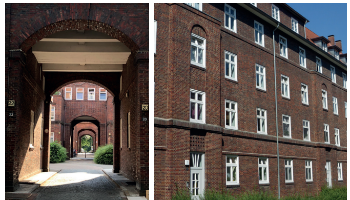
Dulsberg – städtebaulich einzigartig und erhaltenswert