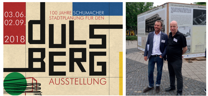
Ein großes Dankeschön an alle Organisatoren und Sponsoren

Ob frisch umgesetzte Projekte, Veranstaltungen, das integrierte Entwicklungskonzept für den Dulsberg, Fotos von besonderen Orten im Quartier, Kontaktdaten von Ansprechpartnern oder Informationen zum Verfügungsfonds und dem Fördermittelkompass – alles Wichtige, was den Dulsberg bewegt, finden Sie auf unserer Webseite www.dulsberg-denkmalschutz.de . Schauen Sie gerne vorbei!